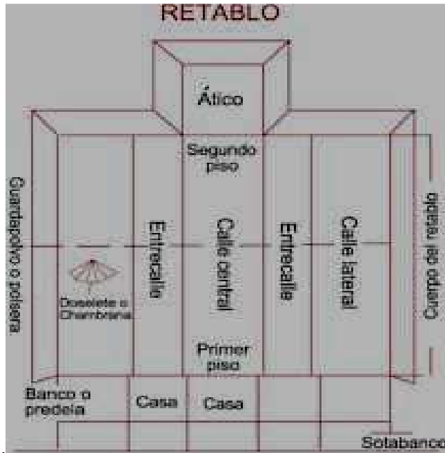
Esquema de las partes de un retablo

Diccionario de términos de arte y arqueología de G. Fatás y G. M. Borrás